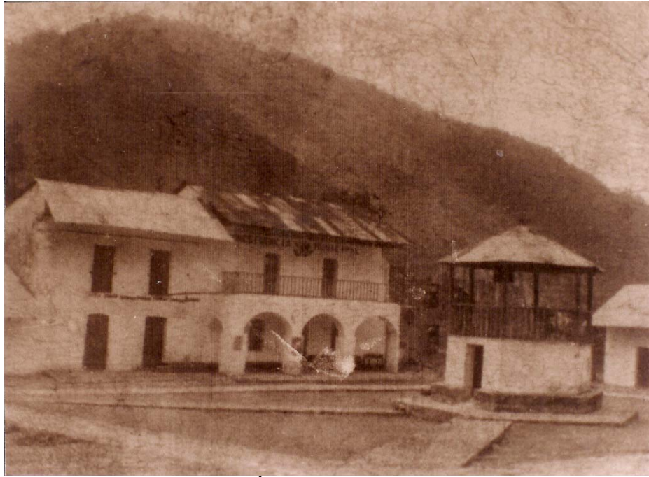
PLAZA JUÁREZ ALREDEDOR DE 1920