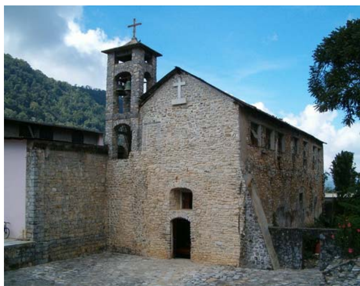
IGLESIA DE SAN PEDRO APOSTOL