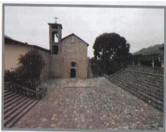
Ex Convento Agustino del Siglo XVI