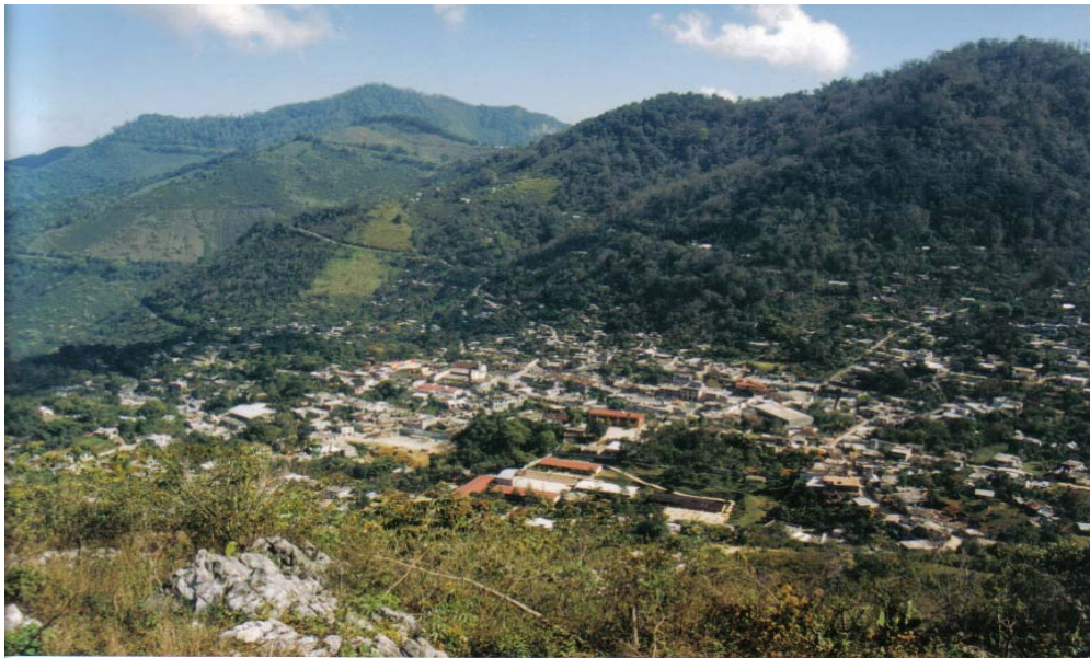
PANORÁMICA DE CHAPULHUACÁN