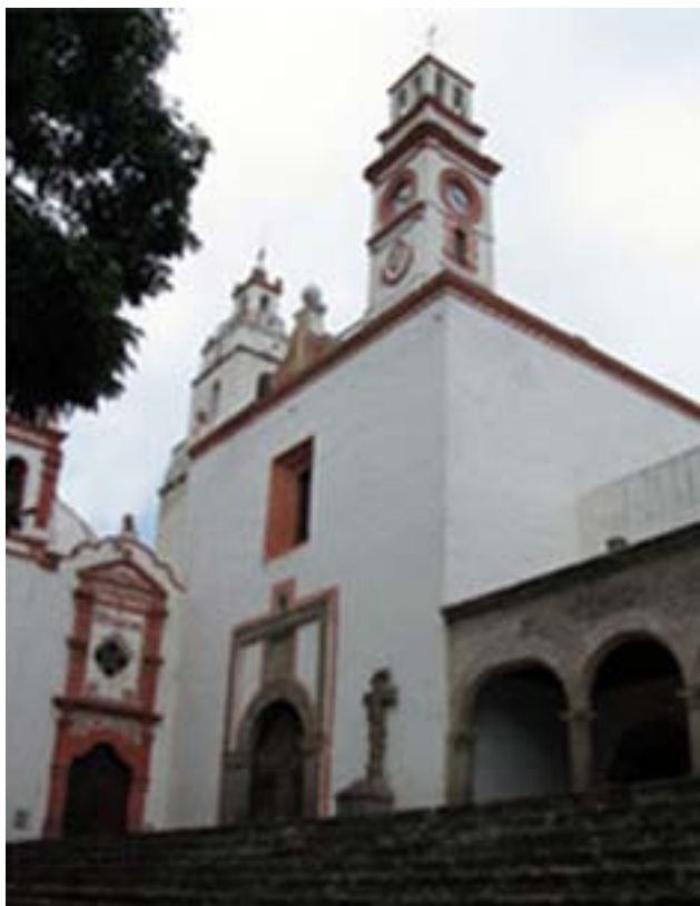
SAN FRANCISCO DE ASÍS, TEPEAPULCO, HIDALGO