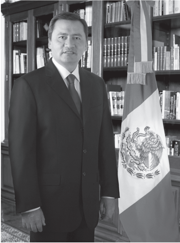
Miguel Ángel Osorio Chong Gobernador Constitucional del Estado de Hidalgo