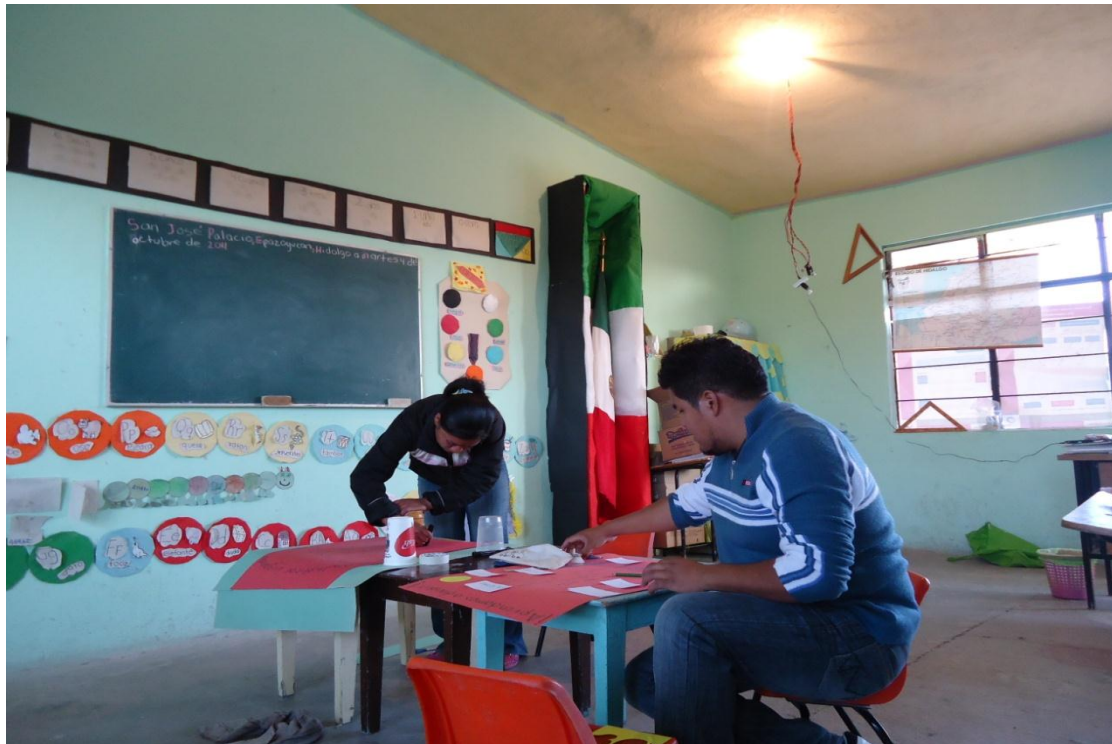
Elaboración de materiales para el trabajo con el grupo.