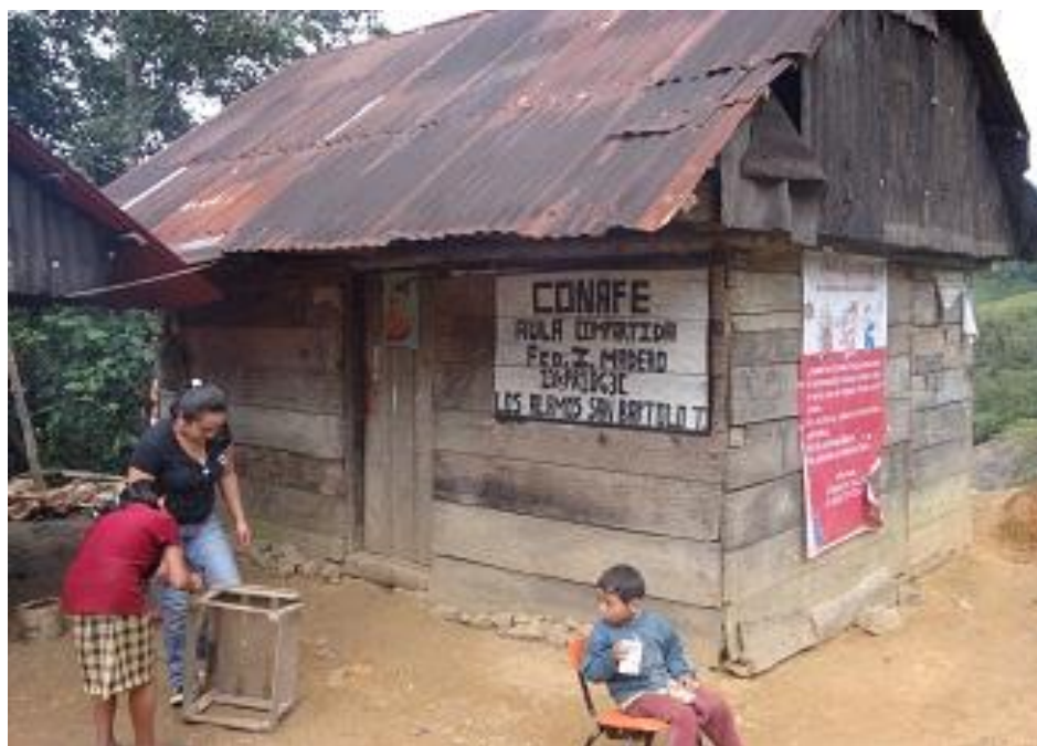
Arreglando el mobiliario para la asesoría pedagógica