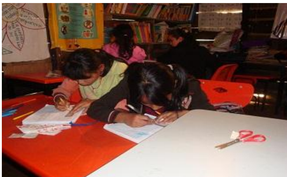
Asesoría con alumnas focalizadas