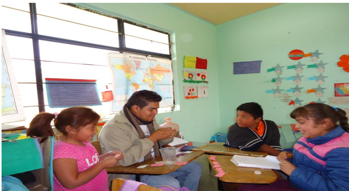
Trabajo con los alumnos focalizados con los números y su descomposición.