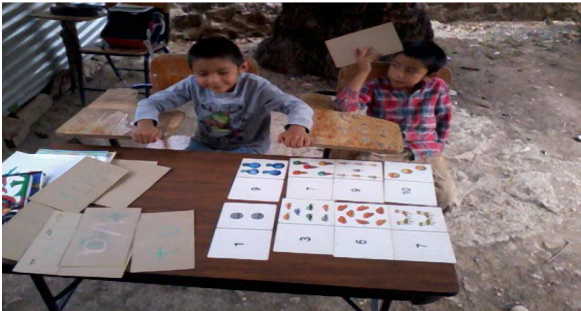
Intervención con alumnos focalizados con los números en colecciones.