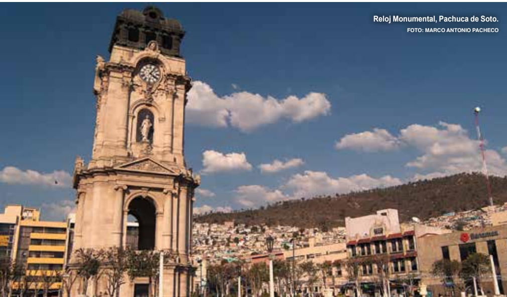
Reloj Monumental, Pachuca de Soto.