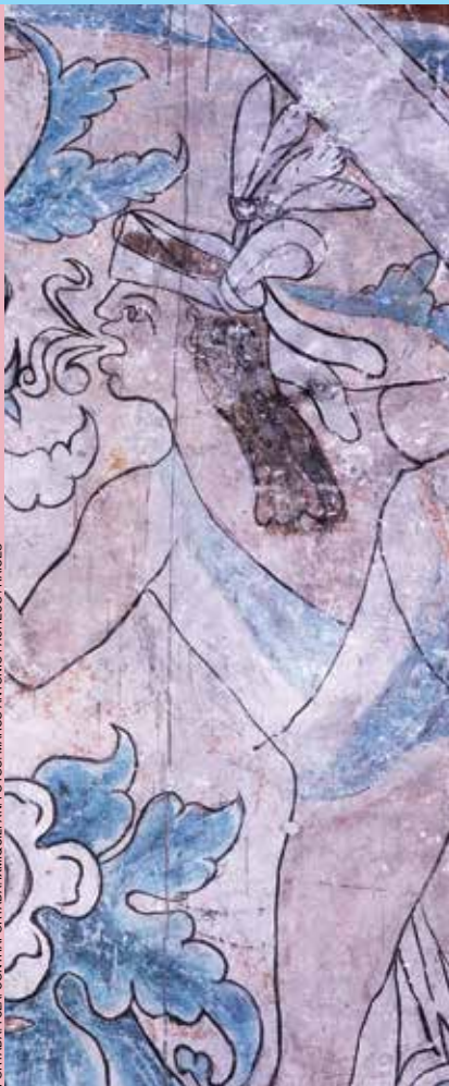
PORTADA: TULA, CONTRAPORTADA: IXMIQUILPAN.