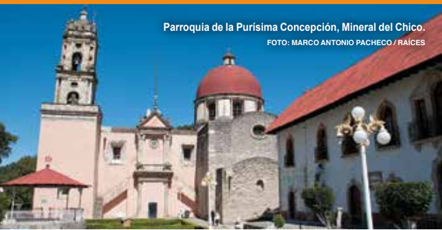
Parroquia de la Purísima Concepción, Mineral del Chico.