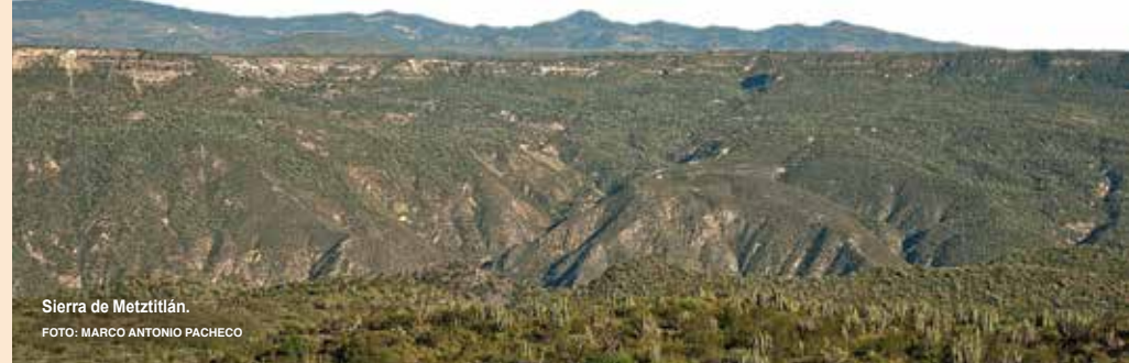
Sierra de Metztitlán.

Es un área natural protegida que abarca varios municipios y conserva gran parte de la biodiversidad desértica mexicana, mucha de ella endémica del estado.