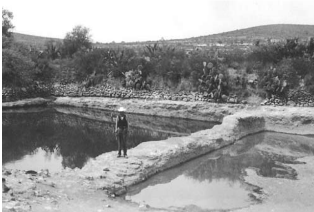
Jagüey Los Corrales, Escobillas, Zempoala, Hgo. (E. Galindo, 2006)