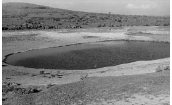
Jagüey Santiago, San Cristóbal, Singuilucan, Hgo. (E. Galindo, 2006)

El principal uso que se da al agua almacenada dentro de los jagüeyes es para abrevadero, principalmente para ganado menor (ovejas y cabras) y en menor cantidad burros, caballos y vacas. En situaciones especiales, como es el caso de las rancherías o viviendas aisladas que no cuentan con agua entubada, o en localidades donde el suministro de ésta es deficiente, el agua de los jagüeyes se usa en los quehaceres domésticos.