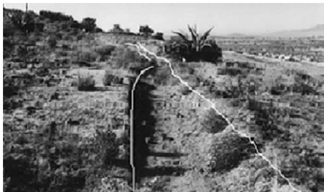
Fotografía 2: Atarjea excavada entre la fracción de una ladera no abierta al cultivo y la primera parcela aguas abajo

Cerro Colorado, Zempoala, Hgo.