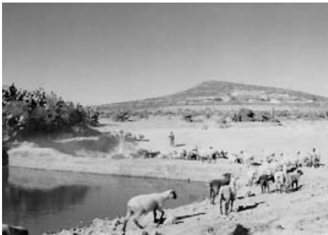
Jagüey Los Corrales, Escobillas, Epazoyucan, Hgo. (E. Galindo, 2006)