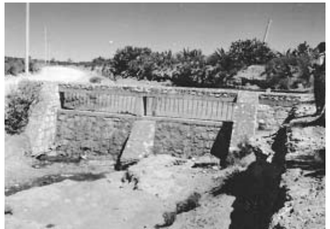
Jagüey Escobillas, Escobillas, Zempoala, Hgo.