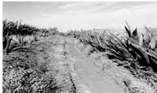
Fotografía 3: Atarjea de reciente construcción entre parcelas sobre ladera abierta al cultivo

Escobillas, Epazoyucan, Hgo. (E. Galindo, 2006)