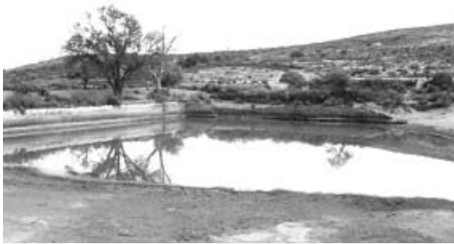
Jagüey Santa María, Chapultepéc, Epazoyucan Hgo. (E. Galindo, 2006)