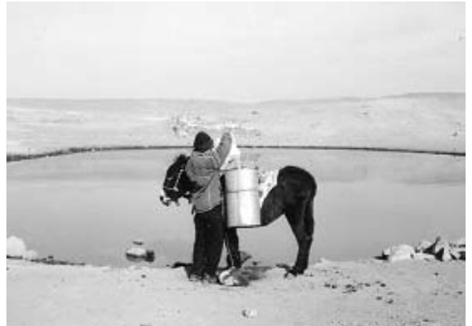
Jagüey Santiago, San Cristóbal, Singuilucan Hgo. (E. Galindo, 2006)