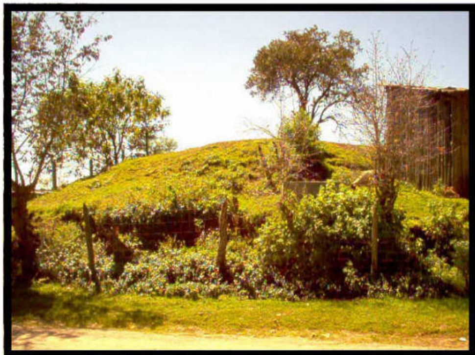
Foto 3.- Montículo arqueológico en la comunidad de Los Cubes, Agua Blanca de Iturbide, Hgo.