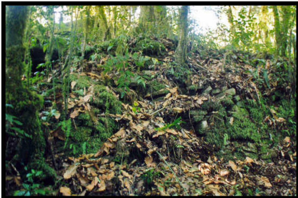
Foto 1.- Montículo arqueológico del sitio Cerro Negro localizado en el municipio de San Bartolo Tutotepec en la Sierra Otomí-Tepéhua.