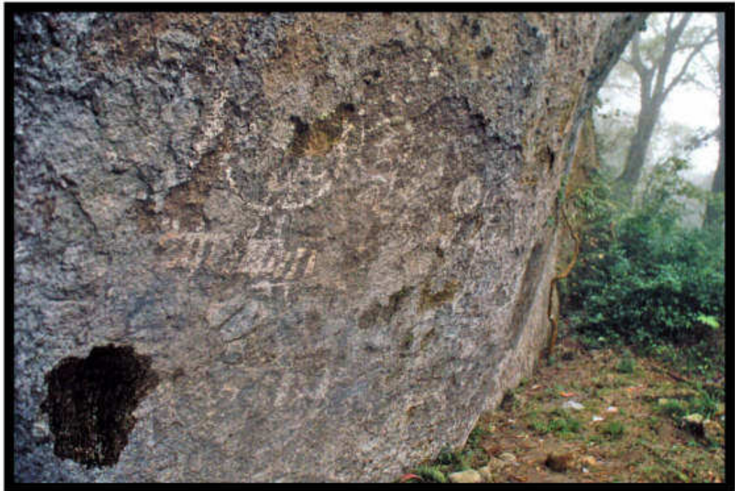
Foto 2.- Motivos rupestres presentes en la Cueva del Ajolote en el municipio de Tenango de Doria, Sierra Otomí-Tepehua.