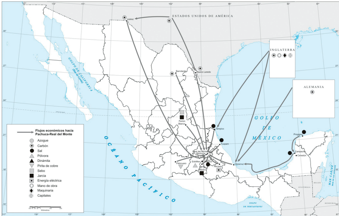
Figura 4. Flujos económicos hacia el distrito minero Pachuca-Real del Monte en la segunda mitad del siglo XIX.

Pachuca, Real del Monte, Omitlán, Huasca y todas aquellas haciendas de beneficio, ranchos, unidades de explotación forestal y fábricas pertenecientes a la empresa o controladas por ella (Figuras 2 y 3). El valle de Tulancingo, las llanuras de Tizayuca, Zempoala, Singuilucan y los alrededores de Pachuca, proporcionaban los granos, forrajes y otros productos agrícolas necesarios para los operarios de las minas y el ganado; de los llanos de Apan se llevaba el pulque, especialmente a partir de la construcción de las líneas de ferrocarriles que cruzaban la región. Asimismo, la Compañía se abasteció de madera, leña y carbón vegetal de los bosques aledaños a los centros mineros, pero debido a la tala inmoderada tuvo que obtenerla de zonas cada vez más alejadas. Para ello, compró tierras de uso forestal a bajo precio; cabe destacar una propiedad con la que contaba próxima a Tulancingo que constituía uno de sus principales centros de abastecimiento; el producto se transportaba al área minera por ferrocarril.