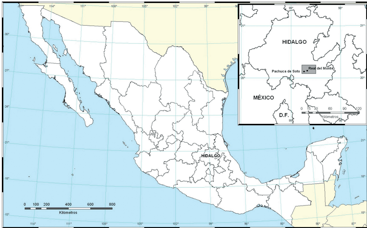
Figura 1. Localización del área en estudio.

su estudio ha sido poco abordado por la geografía minera histórica (Téllez, 1998), especialidad cuyo estudio corresponde actualmente a la geografía industrial, definida