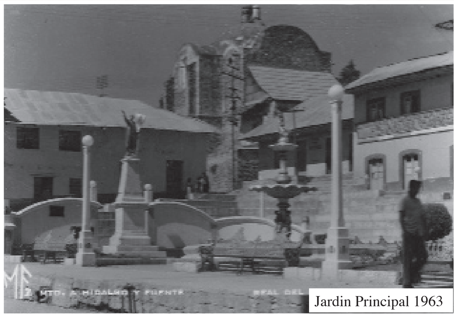
Jardin Principal 1963