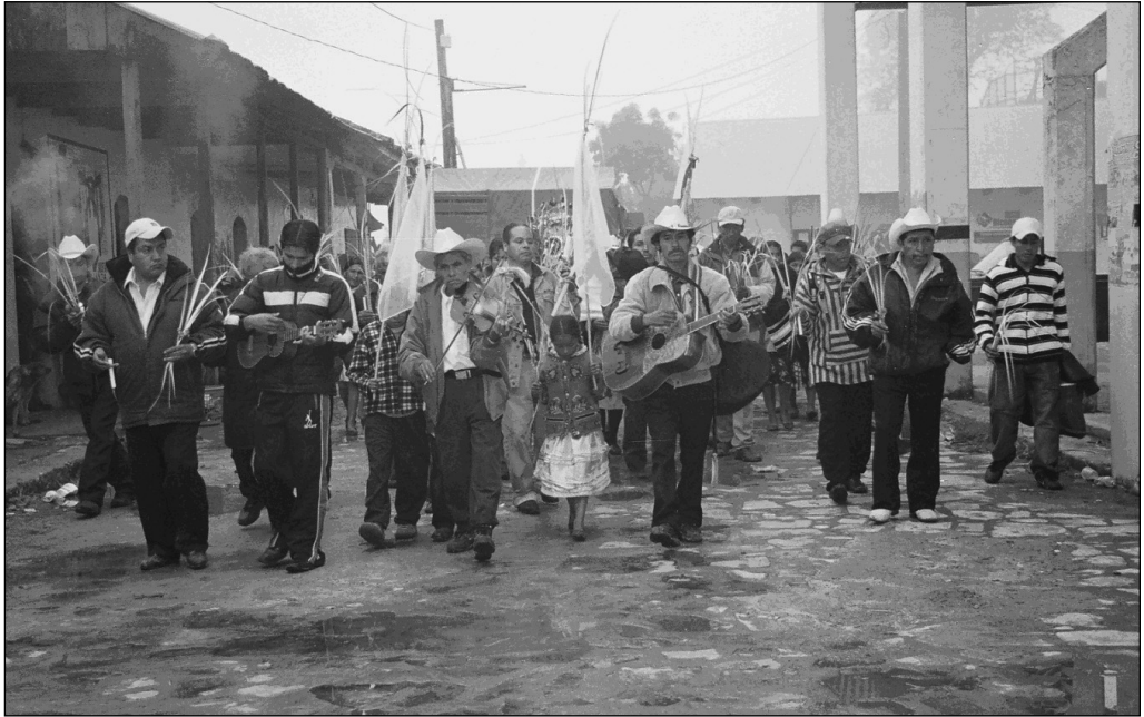
Fig. 10 Mayordomos para el Costumbre de La Campana. Localidad de Tutotepec.

mo, los mayordomos para “el costumbre” de la campana en Tutotepec se eligen dos años antes y empiezan a tener obligaciones desde este momento (Fig. 10) 48 .