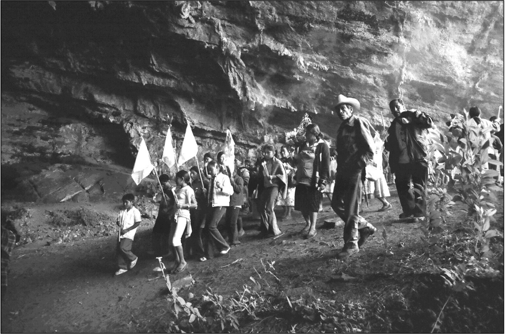
Fig. 11 El ritual en La Gruta. Localidad de Los Manantiales.

La comunidad y el lugar habitado (localidad) son dos cosas diferentes, pues la primera incluye, en términos simbólicos y cognitivos, lugares no habitados, como las tierras de cultivo, ojos de agua, cementerios o porciones de río 64 . De esta forma, aunque se trate de localidades que poseen un patrón disperso o de conjuntos agrupados, la relación de las partes entre sí es esencialmente la misma: integrar un territorio a través de mecanismos de reciprocidad que se expresan visiblemente en los rituales. Existe la posibilidad de definir a la comunidad tomando distancia de los criterios de subdivisión municipal que maneja la ley y verla no sólo como un espacio cubierto por viviendas y lugares de uso público, sino además por el conjunto de personas que comparten una historia, una memoria, “un vínculo genérico [...] así como el sentimiento relacionado de confraternidad” como una comunidad (Turner 1988: 103).