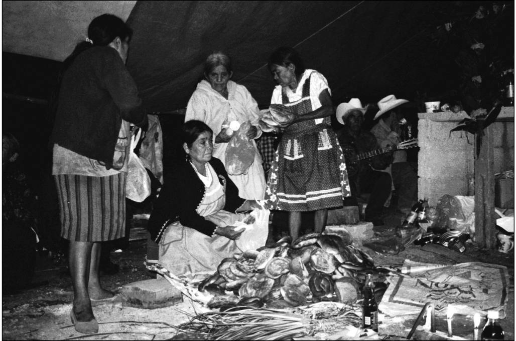
Fig. 8 La Ofrenda. Localidad de San Juan.

A estas figuras llamadas nzaki se les rinde culto en los rituales y se les deposita ofrendas que se denomina con el término otomí de 'bóts'e que se traduce como ofrecimiento y sacrificio. Las figuras 'del mundo de los muertos' constituyen una "cama" que después se convierte en 'bulto' llamado tönts'i'na o la limpia, este 'bulto' es depositado en el "monte" en los cerros donde se dice que habita Zithü'na . También se hacen figuras de papel recortado para curar enfermedades, para realizar brujería y para regresar el ndähi del individuo que dejó en algún lugar donde sufrió de un susto, se cayó o tuvo algún accidente (Fig. 8) 38 .