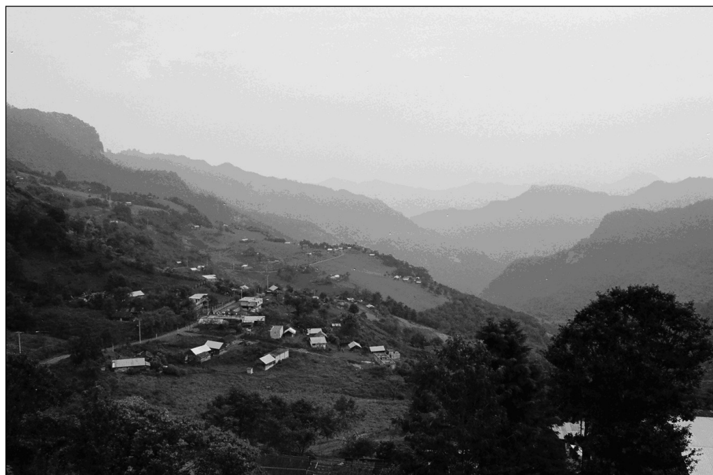
Fig. 3 Asentamiento disperso. Localidad de Xuchitlán.