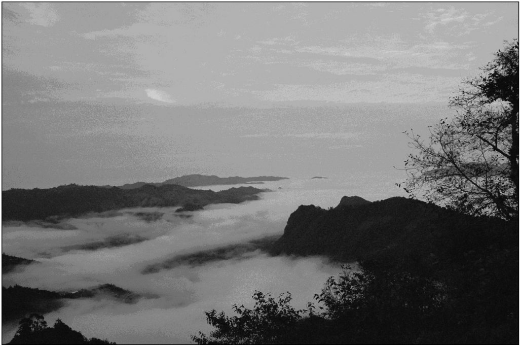
Fig. 1 La Sierra. Localidad de El Encinal.

Esta serranía se ubica dentro de la región hidrológica Tuxpan-Nahutla que alberga al río Moctezuma, con corrientes menores, pero importantes para la población, como son el río Chiflón, la Huahua, Xuchitlán, San Bartolo, Beltrán, Borbollón, Pahuatlán, San Esteban, El Arenal, Huayacocotla, Pantepec y Tenango (Fig. 1).