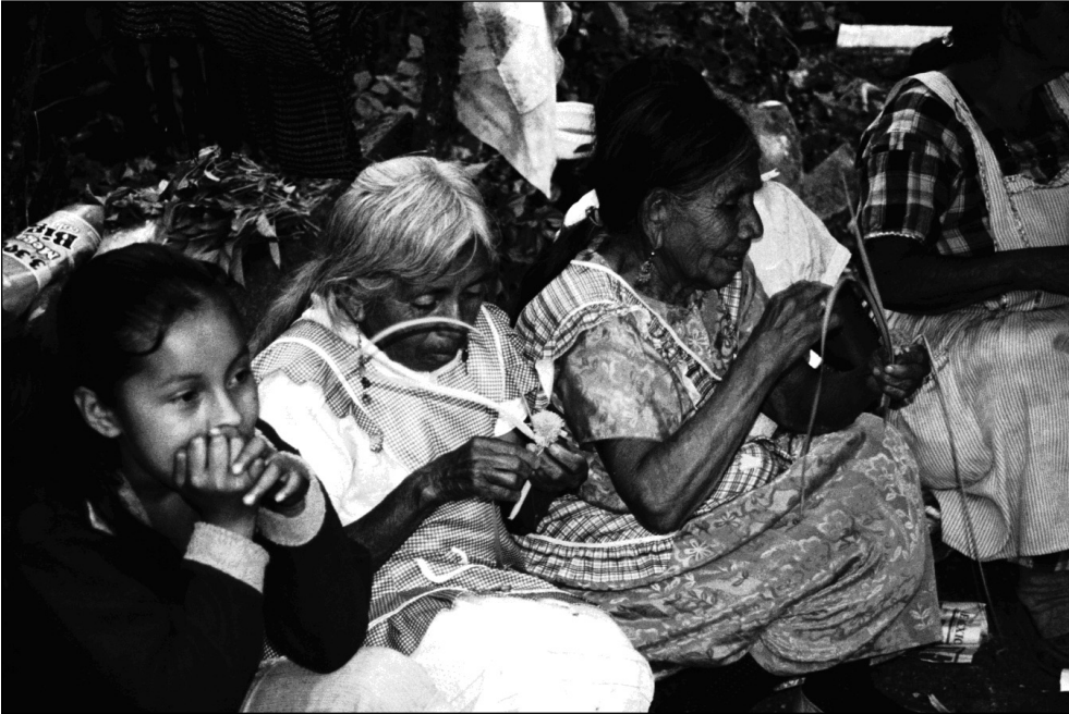
Fig. 9 Mujeres ayudando durante el ritual. Localidad de San Juan.

formas de relacionarse y crear vínculos entre los otomíes son las mayordomías, cuyo objetivo es financiar la fiesta patronal y el carnaval; en este sentido parecen conformar grupos mayores que las familias extensas. Además, en algunas comunidades, como Píe del Cerro, estas relaciones representan un poder real en la medida que los mayordomos pertenecen a alguna de las familias que ostenta el poder en la localidad (los maestros) y se insertan en el carácter rotativo de la estructura de autoridad 46 . Incluso, se puede decir, “que los maestros tienen tanta influencia que pueden transformar algunas actividades, como en Yahualica Hidalgo, donde su participación en el carnaval ha llevado a algunos cambios en el mismo, como es la participación de carros alegóricos como lo hacen en las ciudades” 47 .