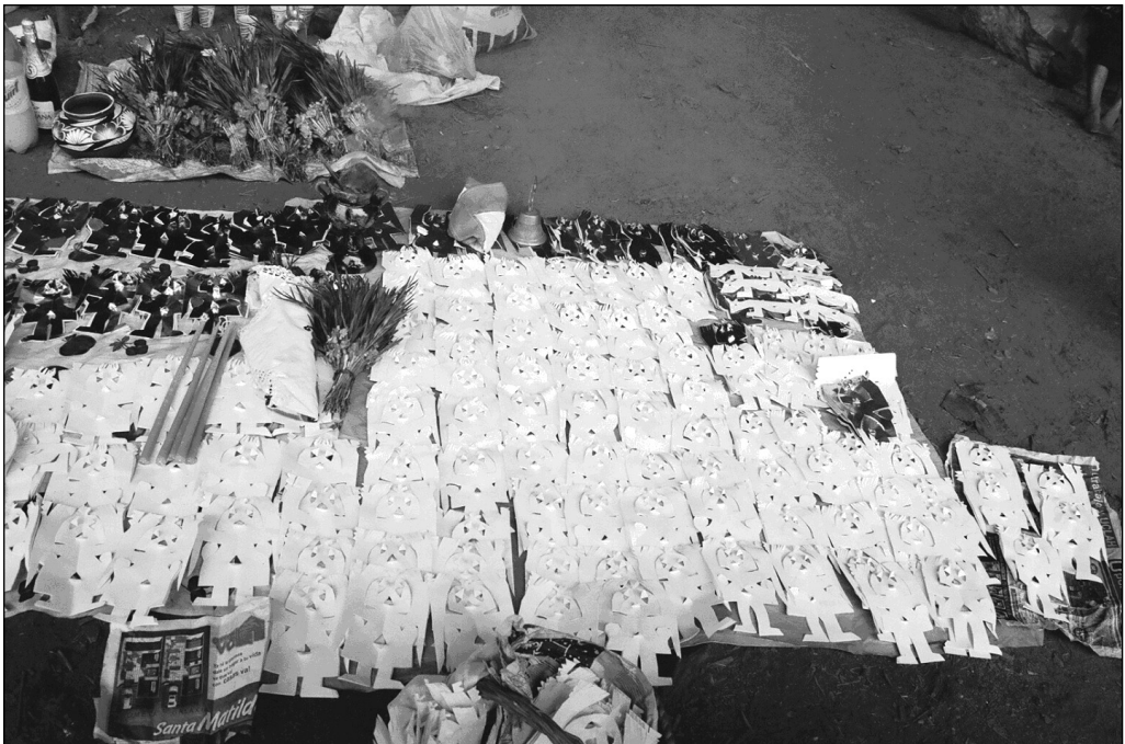
Fig. 7 Las potencias. Localidad de Píe del Cerro.

Todas las ceremonias son llevadas a cabo por especialistas llamados en otomí bādi’na (‘el que sabe’). Este recorta cientos de figuras antropomorfas en papel china, jonote y bond, que son consideradas como “la fuerza” de las potencias. Hacen grandes “camas” de muñecos recortados, algunas de las figuras se visten y depositan en las cuevas y grutas, otras en el “monte” en los montículos prehispánicos y en el fogón casero. Existen características específicas para cada una de las figuras, se colocan de cierta forma, número y por importancia, se les da de fumar, beber y comer, además a algunas de ellas se las sacraliza con la sangre de pollos; se las activa abriendo los pequeños agujeros que contiene cada muñeco (Fig. 7) 37 .