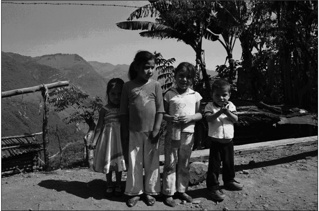
Fig. 4 Los niños. Localidad de La Cerca, San Jerónimo.

Aunque no es la regla, hombres y mujeres adolescentes pueden acceder a un mayor nivel de educación, por lo menos hasta el nivel medio superior o bachillerato. De estos, un porcentaje muy reducido emigra para estudiar en la universidad, pero una vez en las ciudades, los pocos que logran terminar una licenciatura, deciden quedarse a trabajar fuera de su comunidad y organizar su vida allí 21 .