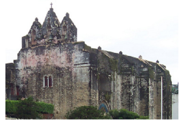
SAGRARIO CATEDRAL HUEJUTLA DE REYES, HIDALGO