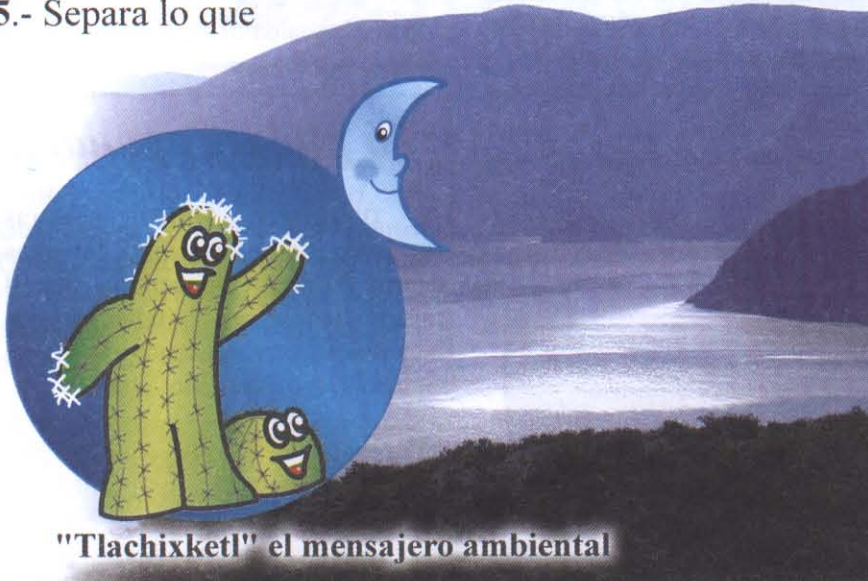
"Tlachixketl" el mensajero ambiental

W N T L M B A S B H M E A I K A J E D R D Y R S T I R T Q R D Z C C A U A E T I O L C N J I N M I H C P T A P M R A E L D O E E F O A R S N C G K N I T T I B F W O A O C W D I U N C L V S J L R M A X V P S E E B I M Ñ D C T L E Ñ R I L E E Z C A K Y O