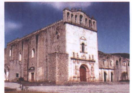
Convento de Los Santos Reyes

Las cualidades que la naturaleza le ha dado a este lugar la constituyen como una región de abundancia en todos los aspectos: la diversidad de plantas y animales, la vega de Metztitlán, la laguna y sus ríos, los maravillosos paisajes así también la riqueza cultural que existe dentro de la comunidades como es el caso del convento de los Santos Reyes, la Tercena o las pinturas rupestres.