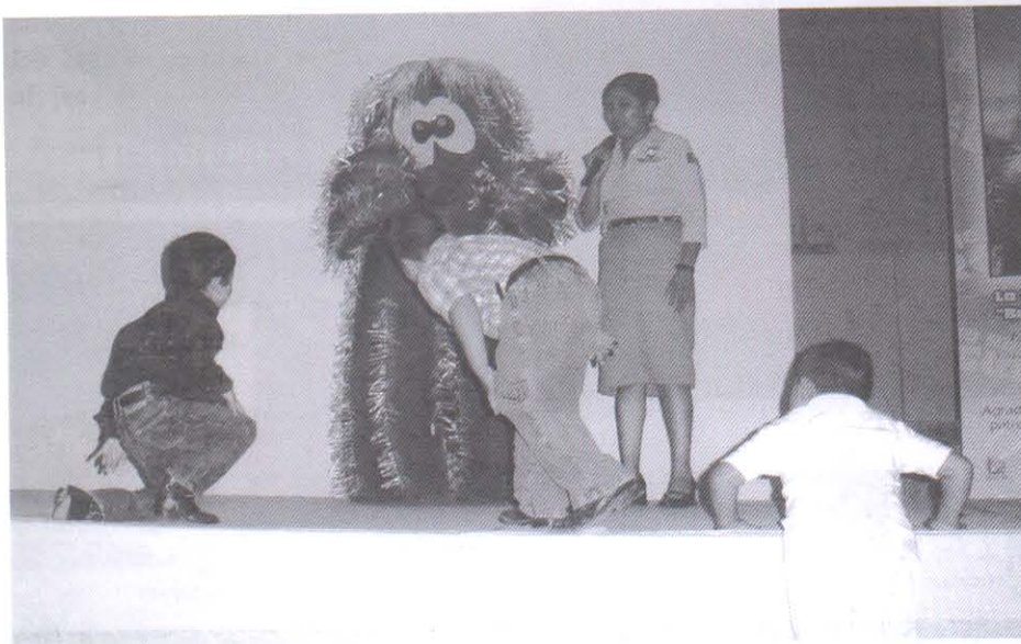
Niños con Tlachixketl durante el evento de inauguración de la Campaña "Viejito"

guiñol, poster, pero sobre todo de un mensajero ambiental que comunique el mensaje, tal es el caso del "Viejito" llamado en lengua náhuatl "Tlachixketl" que significa "el que cuida" "el que vigila" "el que protege", esto debido a que el "Viejito" en su medio natural ha permanecido por años en las barrancas por lo que se ha considerado un "guardián fiel" y de aquí el nombre de campaña "Viejito".