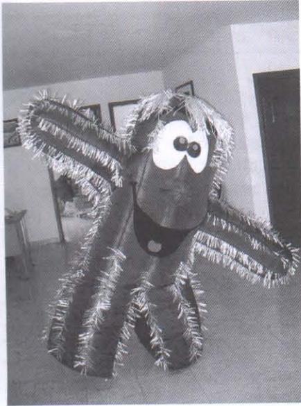
"Tlachixketl" el mensajero ambiental

La campaña "Viejito" es asesorada por personal técnico de RARE y la Universidad de Guadalajara a través del Centro Universitario de la Costa Sur (CUCSUR) y financiada por la fundación interamericana, Niños y Crias A.C y PNUD.