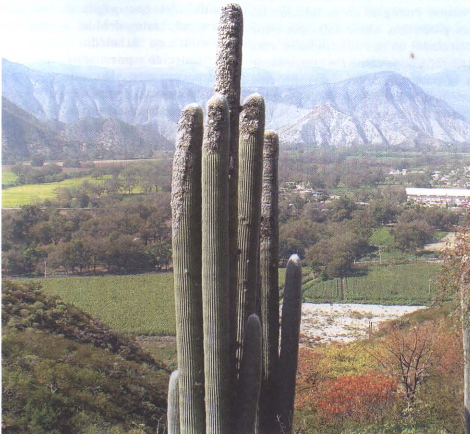
Vista panorámica de la Reserva

Debemos saber que lo que tenemos es algo que no se puede comprar, es algo que no se puede construir, es algo que podemos usar, para beneficiar a las comunidades que habitan esta gran región y fuera de ella, ya que todos disfrutamos de los beneficios ecológicos que genera.