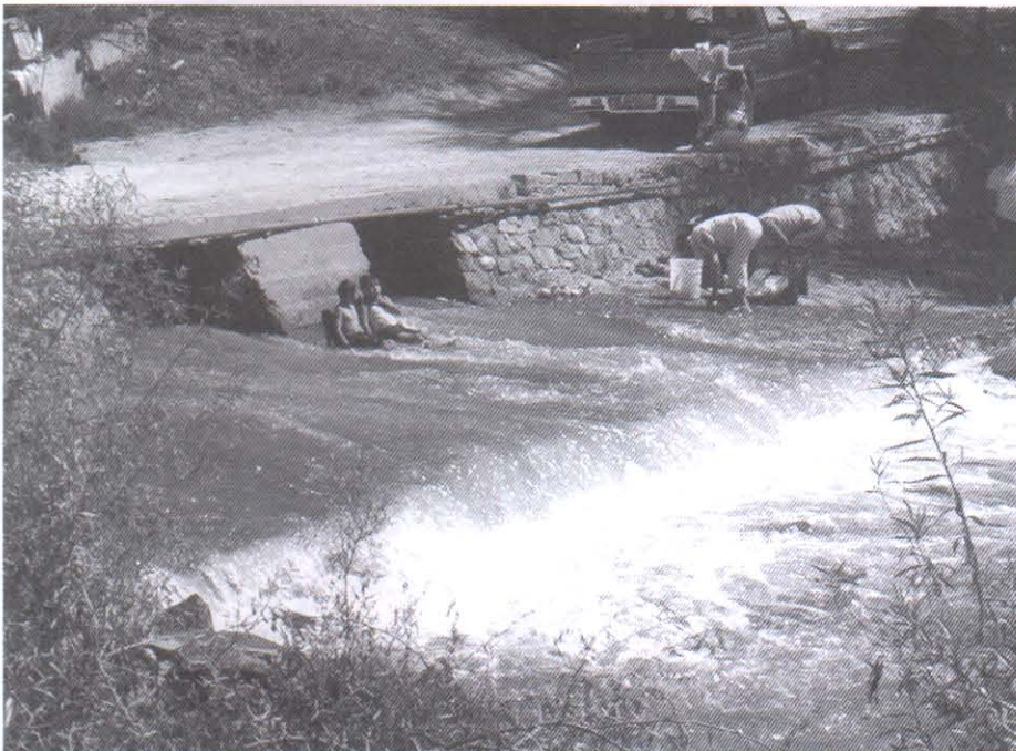
Conviviendo con el agua