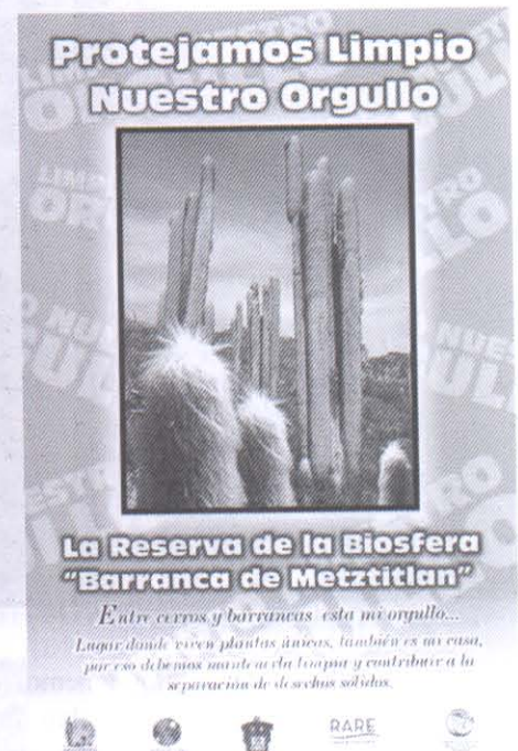
Póster, material impreso para apoyo a la campaña "Viejito".