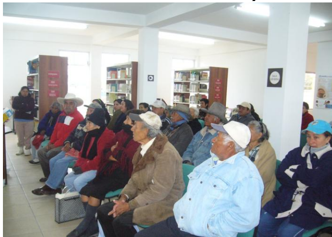
Reunión adultos 70 y mas (AMPLIACIÓN SAN ANTONIO)