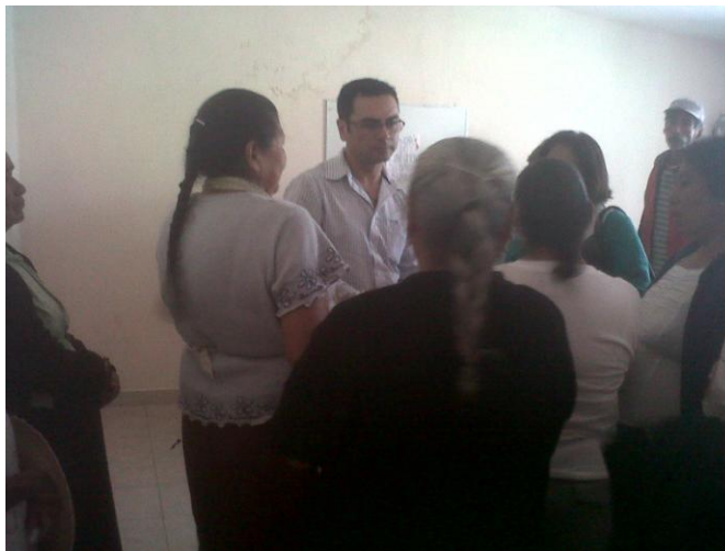
Reunión adultos 70 y más (San Miguel Cerezo, el Bordo y Camelia)