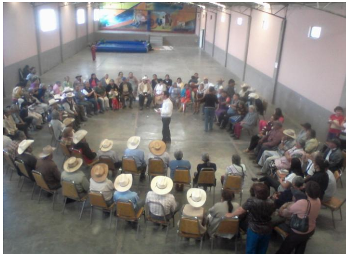
Reunión Adultos del programa 70 y más (SANTIAGO TLAPACOYA, BARRIO JUDIO Y CAMPANITAS)