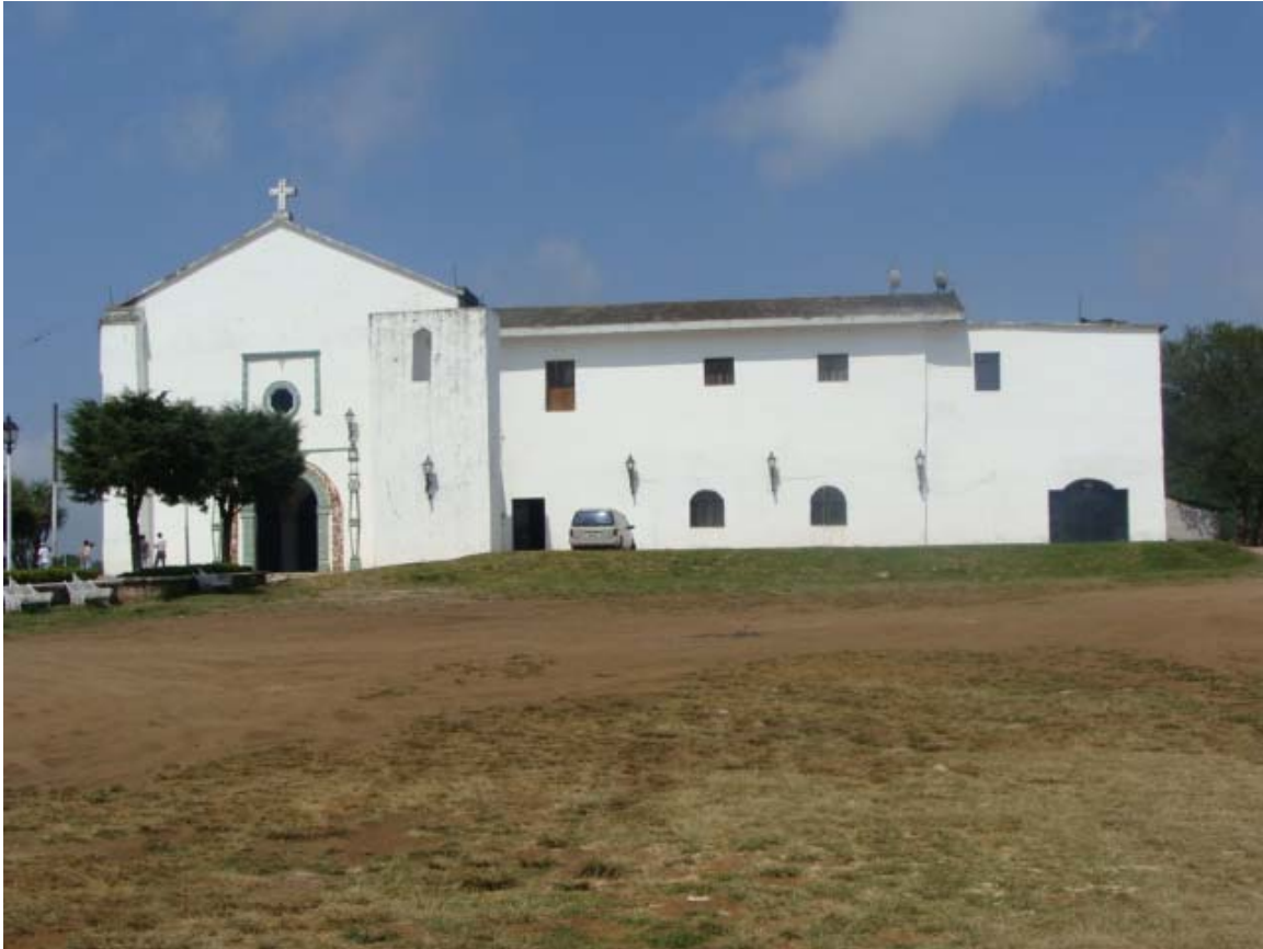
Ilustración 1 EXCONVENTO SAN AGUSTIN VISTA ACTUAL