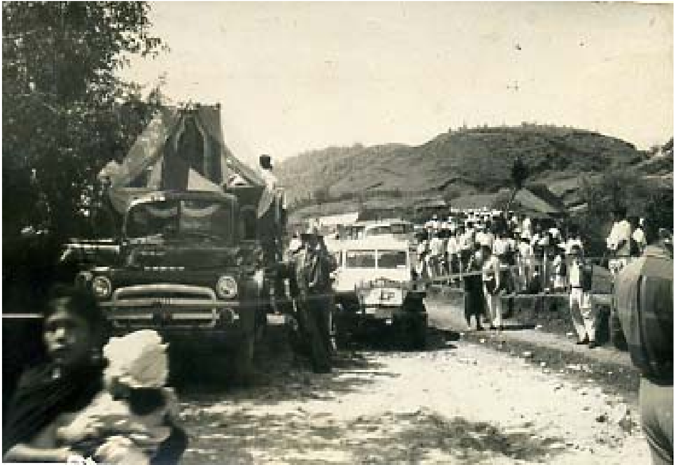
LLEGADA DE LIBROS A LA CABECERA MUNICIPAL POR PARTE DE LA SEP.