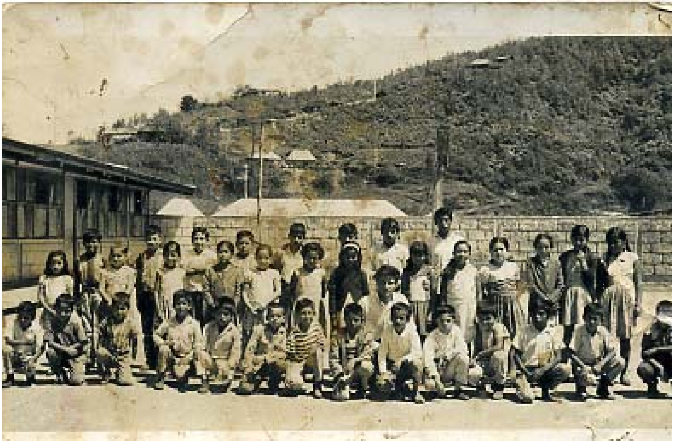
ALUMNOS DE LA ESCUELA PRIMARIA JUSTO SIERRA