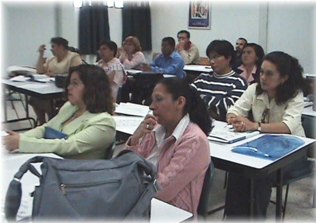
Más de Setenta Prestadores de Servicios Profesionales son capacitados en las áreas de matemáticas, física, Inglés y Español.

Con el objetivo de fortalecer el perfil de los Prestadores de Servicios Profesionales y remediar las problemáticas detectadas en el desempeño de los mismos, en días pasados El CONALEP Hidalgo emprendió un Programa de Fortalecimiento Académico a través de cursos, talleres y seminarios.