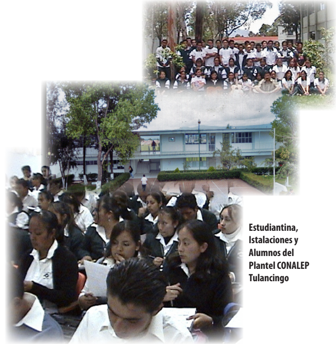
Estudiantina, Instalaciones y Alumnos del Plantel CONALEP Tulancingo

Moderno, Periodismo, Hawaino, Serigrafía, Corte y Confección, Taquimecanografía, Carpintería, etc., así como actividades deportivas: Fútbol, Básquetbol, Voleibol, Atletismo y Tae Kwon Do.