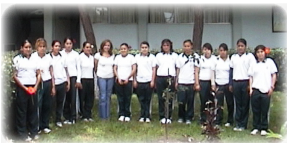
Grupo de baile Hawaino

Se cuenta con todo un programa de actividades, talleres y eventos extracurriculares, culturales y deportivos permanentes que coadyuvan a la formación integral de los alumnos. El plantel ha sido innovador e iniciador de estas importantes actividades desde el año 1992 a la fecha. A nivel Nacional no existe un programa formal ni presupuesto para el desarrollo de estas actividades. A lo largo de 10 años se han ofrecido los siguientes talleres culturales: Danza Folklórica, Teatro, Estudiantina, Pintura, Poesía y Oratoria, Aerobics, Ajedrez, Baile