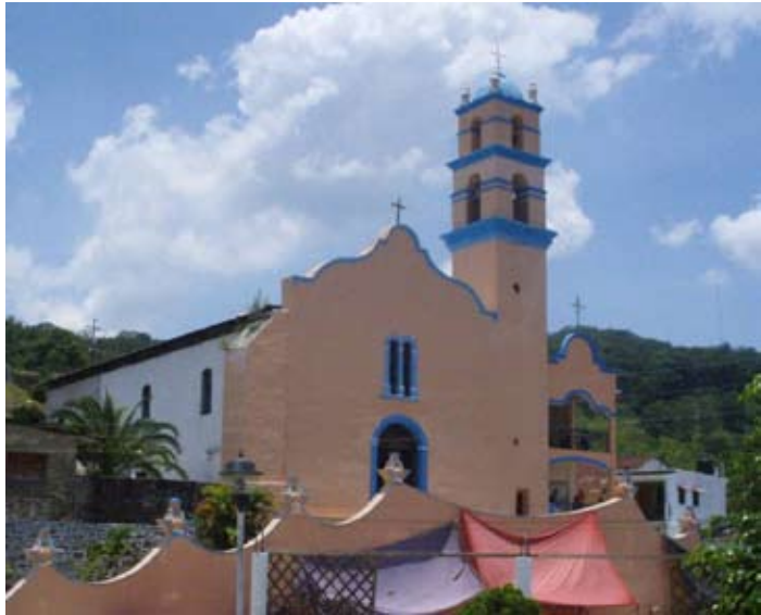
SANTA CATARINA XOCHIATIPAN